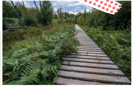
La boulaie du Rouge Poncé